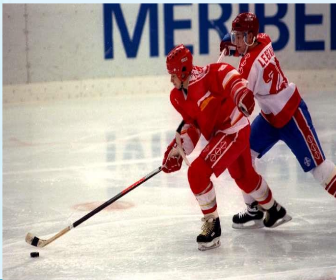
Хоккей с шайбой

Он играет на коньках. Клюшку держит он в руках. Шайбу этой клюшкой бьёт. Кто спортсмена назовёт? (Хоккеист)