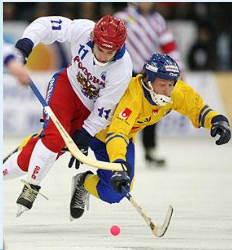
Хоккей с мячом